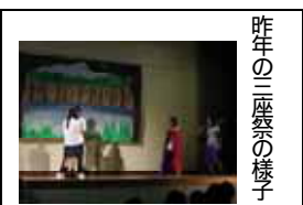
昨年の三座祭の様子

現在、学年ごと、部門ごとの準備が進んでいます。夏休み期間中の三座祭準備は平日9時から16時までとなっています。規則を守って楽しい三座祭にしましょう。