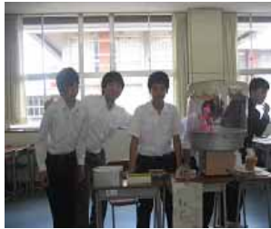
綿がし 食べ過ぎて虫歯に...

体育の部では、障害物競走、借り物リレー、パッションタイム、選抜混合リレー、苺リレー(全員で一五〇〇mを走ります)など、観客席からの応援も最高潮の三座祭最終日でした。ヤバすぎたね!