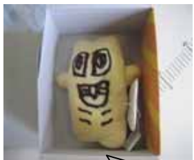
みんな食べてくれてありがと~♡