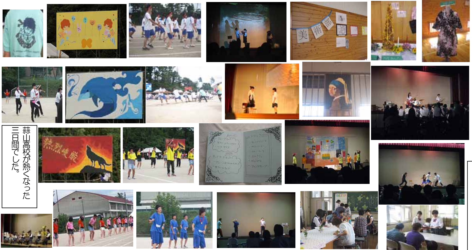
三枚さん・神田さんの撮影した写真を中心に構成しました。