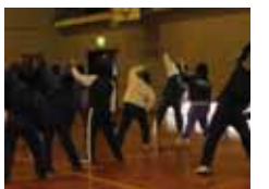
写真は昨年のものです

運動部合同トレーニング(一月十七日~二十一日) 毎年恒例の運動部合同トレーニングが行なわれました。サーキットトレーニングやエアロビクスで汗を流しました。普段から運動をしてもかなりハードな内容だったので、筋肉痛になった人も多かったのではないのでしょうか。