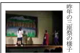
昨年の三座祭の様子

現在、学年ごと、部門ごとの準備が進んでいます。夏休み期間中の三座祭準備は平日9時から16時までとなっています。規則を守って楽しい三座祭にしましょう。