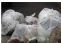
拾って集めたゴミ