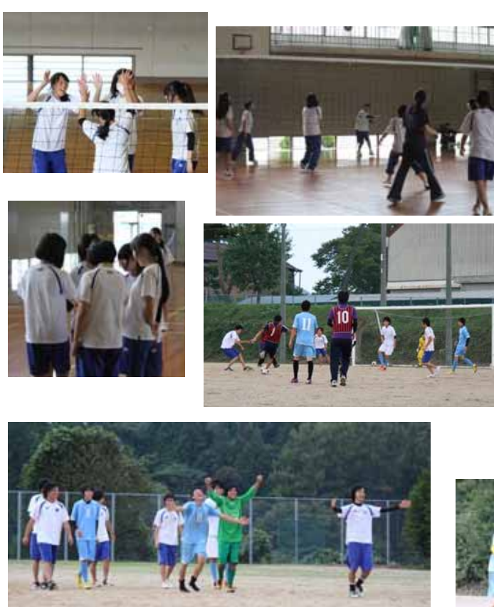
エキシビジョンマッチ PK対決の末 サッカー部 勝利の瞬間