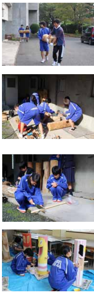
スイトン完成写真は、次号に載る予定です。お楽しみに☆

1年生が毎年作っているスイトンが今年もついに完成しました。木を選んで、削るところから始まり、最終工程の色塗りでは、それぞれの個性が発揮されました。 目のところなど柄が細かいので、にじんできました。ペンキが下に垂れてきてしまったりして、なかなか大変でしたが、どれもきれいに仕上がりました。1年生と教員含め、今年も13体のスイトンが誕生しました。来年はどんなスイトンができるのでしょうか、今から楽しみです。