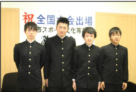
真庭市主催激励会