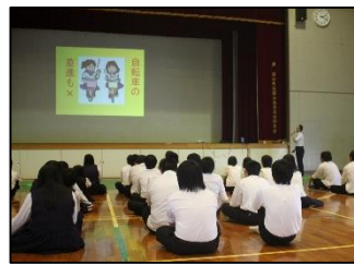
自転車のマナーを学びました

7月1日(水)6限に交通LHRがありました。今年度も新見自動車教習所の方にお越しいただき、話を聞きました。初めに交通に関するクイズをやりました。自分の知識と直感を信じ、みんな楽しんでるに答えていました。その後は傘をさしながらの運転や携帯電話を使用しながら運転するといった、「ながら運転」の危険性について教えていただきました。数人の生徒が実際に体験をし、危険性を理解することができました。今年から自転車の法律が改正されたので、今まで以上に気をつけていきたいと思えました。