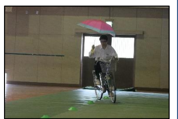
傘さし運転の危険性を体験