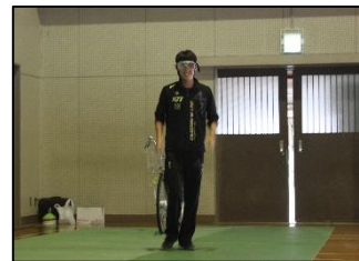
飲酒状態体験ゴーグルを体験