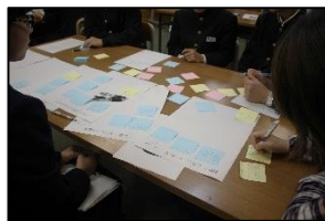
写真は昨年度ドリームミーティングの様子です