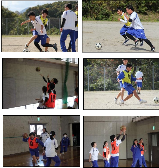
3年生女子は3連勝です!おめでとう!!

3年生はさすが3年生ということで、全員がどんどんシュートを決めていました。2年生も積極的にゴールに向かっていました。1年生は緊張していたからか、少し遠慮気味でした。次の球技大会では勝利目指して積極的にいきましよう!女子のバスケットボールでは教員とのエキシビジョンマッチが行われ、大変盛り上がっていました!