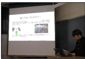
課題研究、就労訓練のまとめを発表しました