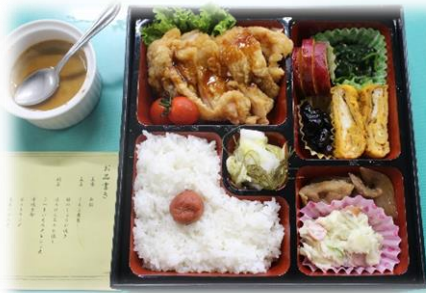
完成した松花堂弁当はこちら!! おいしくいただきました!

毎年地域創造コースの3年生がフードデザインの授業で作っている松花堂弁当を今年も作りました。今回のメニューはチキン南蛮、豚のしょうが焼き、ほうれん草のお浸し、さつまいものオレンジ煮、厚焼き卵、ポテトサラダ、黒豆の含め煮、白菜の漬物、紅茶プリンでした。出来上がった松花堂弁当を先生方に食べていただきました。自分のためだけでなく誰かのために料理するのはやりがいがあり、とても楽しかったです。