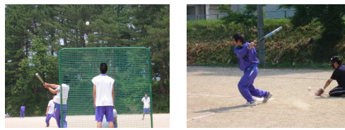
迫力ある戦いぶりでした（男子チーム）

梅雨時期の開催ということで降雨が幾分心配されましたが、天候にも恵まれ予定通り球技大会が開催されました。男子・女子ともに三年生が優勝しました。特に男子は三年生の力が傑出しており、堂々の貫禄勝ちでした。女子は下位の対戦では、二年生チーム・一年生チームが三年生を倒す場面も見られました。来年が楽しみです。