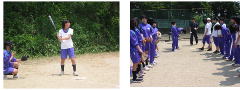
力を合わせて頑張りました（女子チーム）