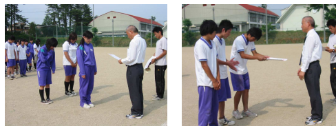
表彰式：男子優勝3年A組、女子優勝3年B組