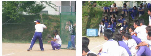
教員チームも参加。たくさんの声援ありがとう。