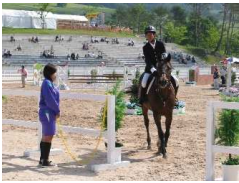
入退場門の開閉作業