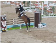
障害飛越競技の様子