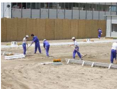
馬場を整地する生徒

六月三日～五日蒜山高原ライディングパークにおいて、国体リハーサル大会（馬術競技）が行なわれました。本校からは一・二年生全員がボランティアとして参加しました。馬場の整地、競技場の入退場門の開閉、選手・競技馬の誘導、採点表の計算など、様々な係りをこなしました。十月二十一日からの秋季国体本番にもボランティアとして参加し、競技の円滑な進行のお手伝いをします。みんなで力を合わせて「もてなすんじやくー！」