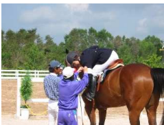
馬の乗り降りの補助