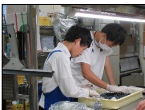
学校の授業ではできない貴重な体験をさせていただきました