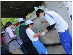
カレー作りのお手伝い