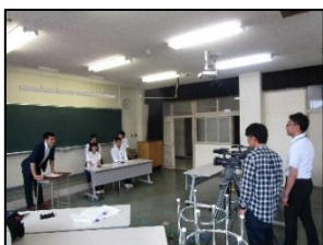
慣れないテレビ取材に緊張しました

秋にも第2弾として「シゴトバ」へ出演する予定となっています。蒜山校生が地元企業を紹介する姿をぜひテレビで御覧ください!