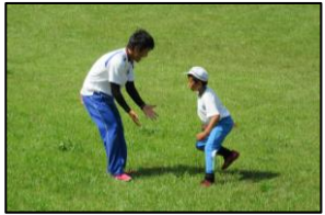
しっぽ取りの最中