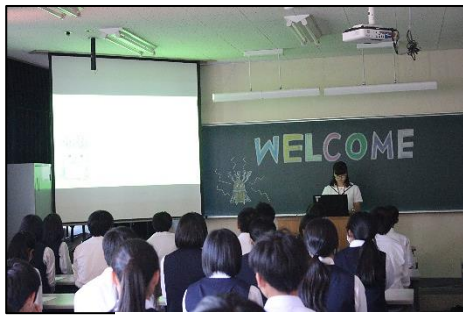
学校紹介プレゼン

学校紹介のプレゼンでは、学校行事や総合進学・地域創造の2つのコースなど、中学生在理解しやすいよう工夫して説明をしていました。その後、校内案内を行い、1年生一人ひとりが工夫して校内の説明をしました。