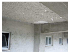
3年棟下天井の様子