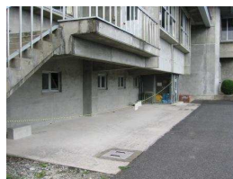
3年棟下 (原付置き場)