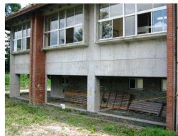
1年棟下 (北側を写す)

最近ニュースを賑わせている asbestos ですが、本校でもその使用が疑われる箇所を現在調査中です。壁の吹きつけに「蛭石」「ロックウール」(ともに asbestos の一種)が含まれており、これらのものが1%以上含有されている場合は除去する必要があります。壁の一部を採取し、含有量を調査しています。結果が出るまでに一ヶ月ほどかかります。結果が出したい報告させていただきます。 屋外の調査箇所については、写真のようにロープを張り、立ち入り禁止区域としています。三年棟下は原付置き場だったので、利用者には不自由をかけますが、体育館西側の自転車置き場に置くよう協力をお願いします。 (調査箇所) 一年棟下、二年棟下、三年棟下、一年棟渡り廊下の天井、三年棟渡り廊下の天井、本館階段部分の天井等です。