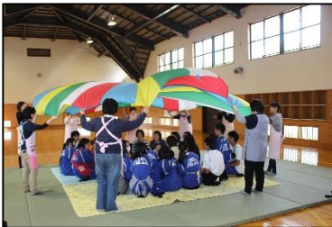
今回の4コマは「乳児ふれあい体験」についてだよ!