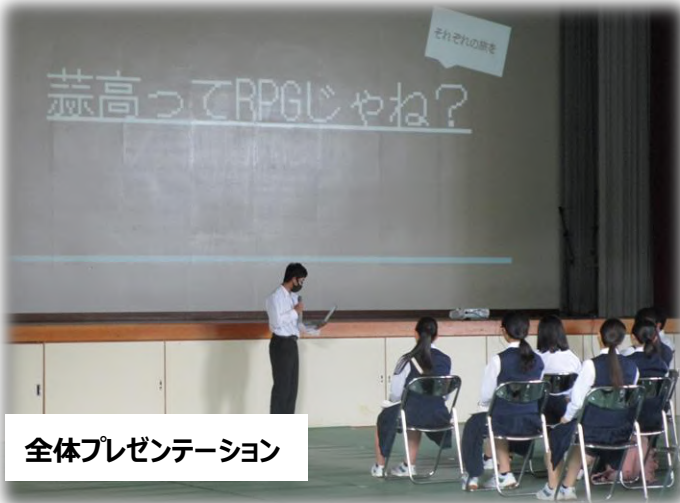
全体プレゼンテーション