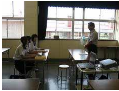
オープンスクール開会式

今年度は湯原中学校からの三名の生徒が参加しました。学校の概要説明のあと、調理教室でピザ作りの体験授業を行いました。生徒たちの作ったピザはなかなかのものだったようですが、教員の作ったピザが「もんじゃ焼き」みたいになってしまつて笑いを誘っていました。なぜ蒜山高校のオープンスクールに参加しようと思ったかというアンケートに対し、生徒たちは、「蒜高に入学したいから」、「どんなことをするのか興味があったから」、「楽しそうだから」といったそれぞれの気持ちを書いていました。なお、蒜山中学校三年生全員対象のオープンスクールは九月二十二日(金)に実施する予定です。