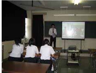
パワーポイントを使った学校紹介