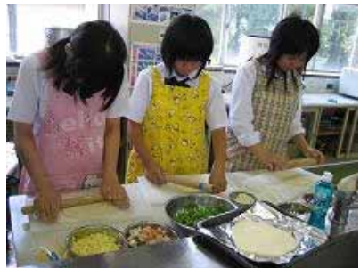
ピザ作りの体験授業