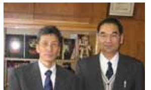
「平凡を非凡に重ねる」 鳥取校長(左) 菱川教頭(右)