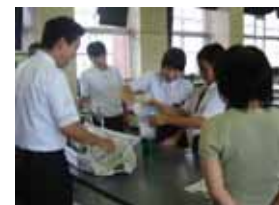
理科の実験の1コマ

中和中学校、湯原中学校の生徒さんを中心に十名の参加がありました。学校の概要説明の後、授業体験(理科の実験・調理実習)を行いました。調理実習ではピザを焼いて食べました。実施後のアンケートでは、体験授業が楽しかったという感想が多数寄せられました。