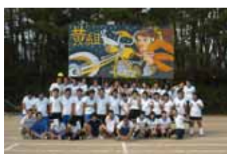
パネルの優勝 (黄団)