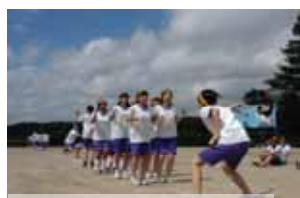
Jumping Rope 50

絶好の体育祭日和の中、体育祭が行われました。生徒数が減ったため、今年から競技については学年縦割りの一〜三年合同チームで、応援合戦(パッションタイム)は学年ごとという変わった方法で行いました。競技の部優勝は青団、パネルの部優勝は黄団、応援の部優勝は三年生でした。また、体育祭前日に草取りをお願いしたところ、お忙しい中、PTA役員の方を中心に二十数名の保護者の方にご参加いただきました。きれいなグラウンドで体育祭を行うことができました。