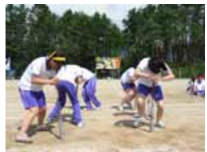
障害物競走 (ぐるぐるバット)