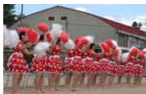
パッションタイム (3年女子)