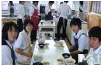
一年生 調理実習風景