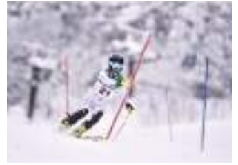
ウインタースポーツ部