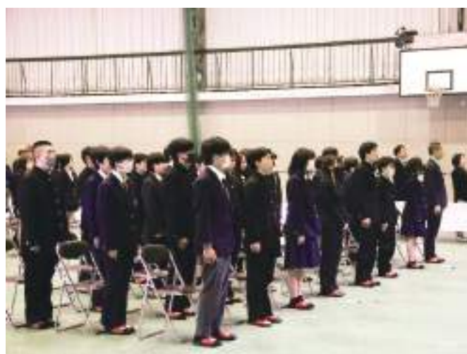
通称「式典モード」。式典等ではフォーマルな服装を着ることが、蒜校生の不文律であり、プライドでもある。Cタイプは「襟付きシャツ・夏以外はネクタイ」を着用する。