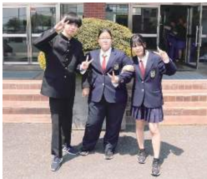
冬服：Aタイプ／Bタイプスラックス／Bタイプスカート