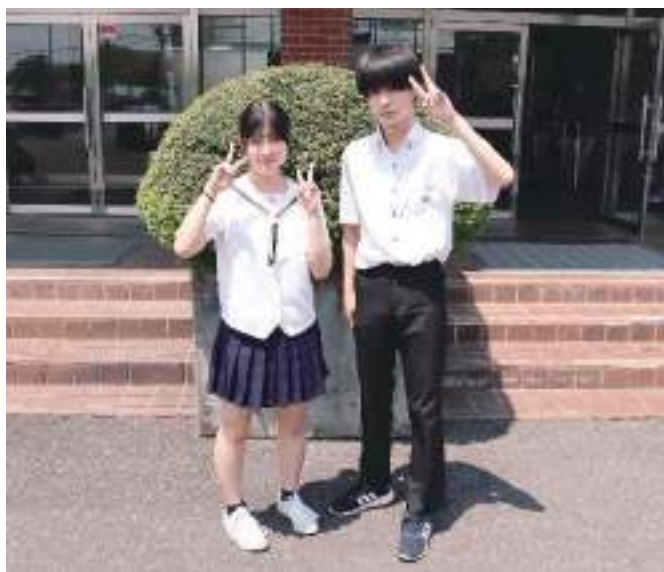
夏服：Bタイプスカート／Aタイプ