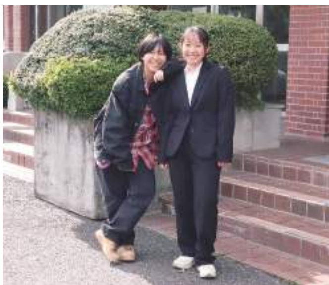
Cタイプ（通常モード）／Cタイプ（式典モード）