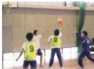
バスケットボール同好会